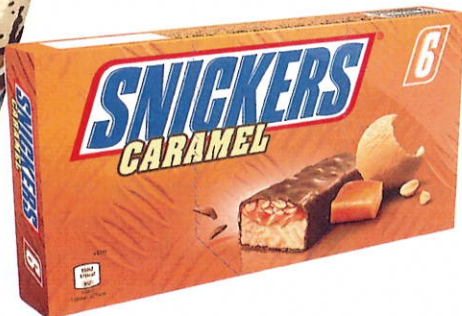
Zwei Topseller 2016 für Mars: Das „Snickers-Eishörnchen“ und der „Snickers Caramel Ice Cream Riegel“.

Mit dem „Snickers Caramel Ice Cream Riegel“ und dem